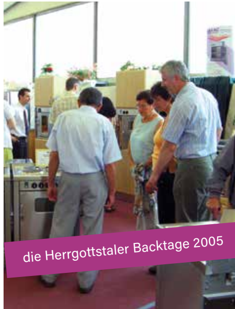
die Herrgottstaler Backtage 2005