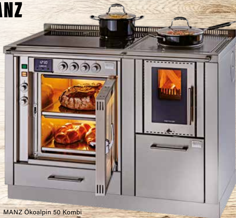
MANZ Ökoalpin 50 Kombi

Die Kombination mit einem MANZ-Backofen Ihrer Wahl und dem passenden MANZ Kochfeld macht diese Kombi zu einer wirklich perfekten Einheit und zum Glanzstück in Ihrer Küche.