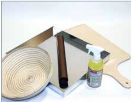
MANZ Basis-Set für 1 Backetage