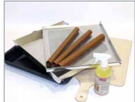
MANZ Basis-Set für 3 Backetagen

Damit Sie gleich perfekt loslegen können, schenken wir Ihnen beim Kauf Ihres MANZ-Ofenmodells das passende Basis-Zubehörpaket - ganz egal für welches Modell Sie sich entscheiden!