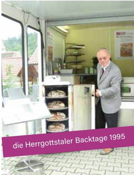
die Herrgottstaler Backtage 1995