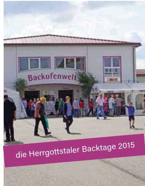
die Herrgottstaler Backtage 2015