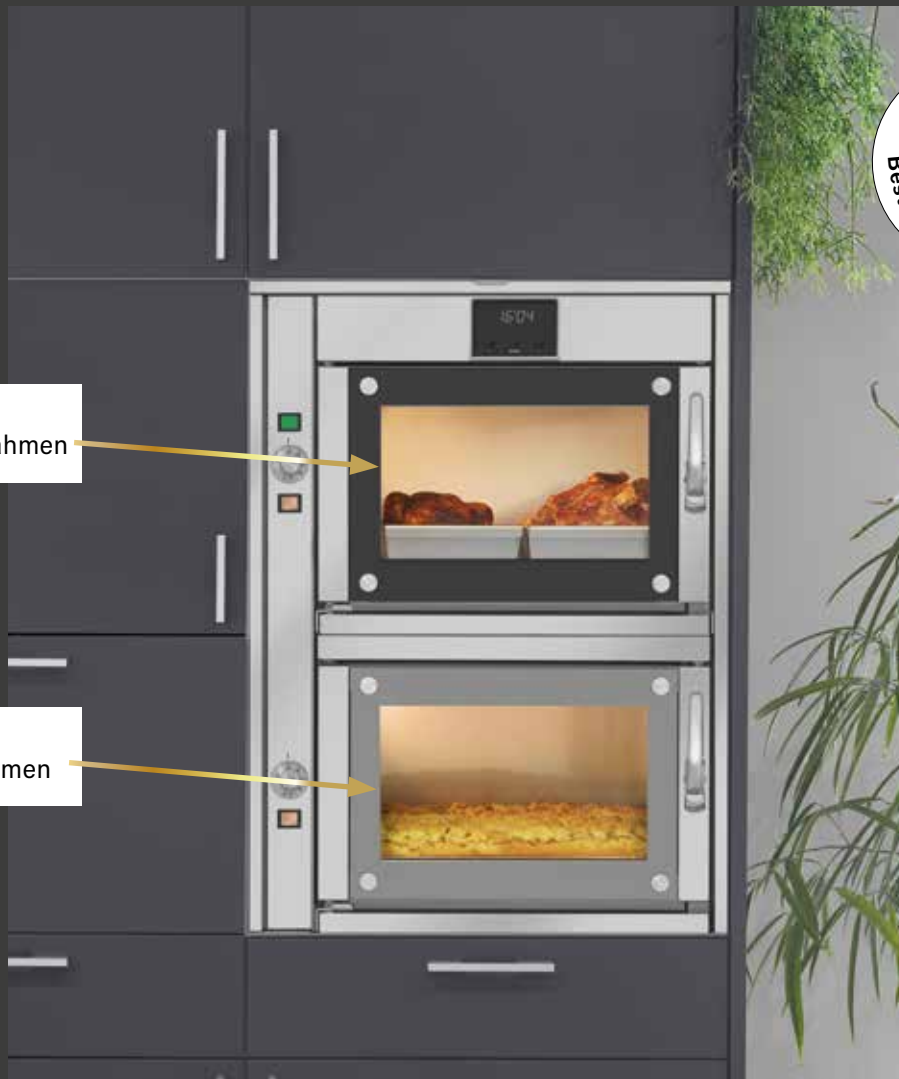
MANZ-Ofen Modell DH 2

Die Aktion - Rahmenfarbe sowie 0% Finanzierung - gilt für alle Bestellungen, die bis zum 30. Juni 2023 bei uns eingehen.