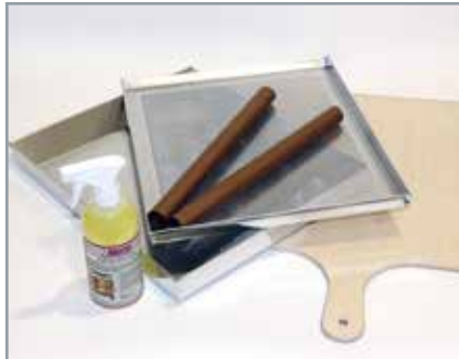
MANZ Basis-Set für 2 Backetagen