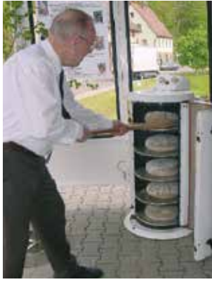
Seit 1962: Das MANZ Backsystem mit ruhender Backatmosphäre